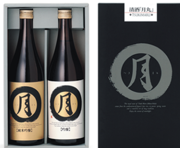
【TS-722A】 純米吟醸・吟醸 720ml