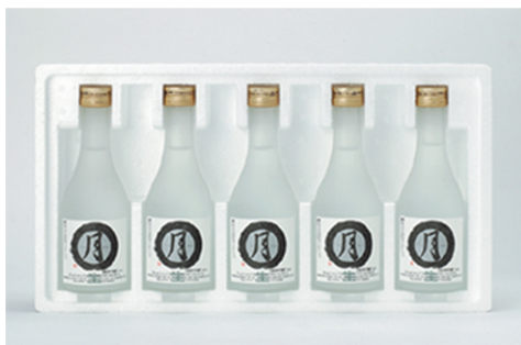
【TN-305N】 純米吟醸生酒 300ml