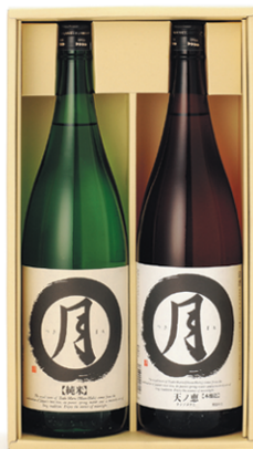
【TS-182C】 純米・本醸造 1,800ml

越前・福井の豊かな自然環境が育み、厳選された素材、 蔵人の卓越した技術と深い愛情が醸し出す逸品たち。